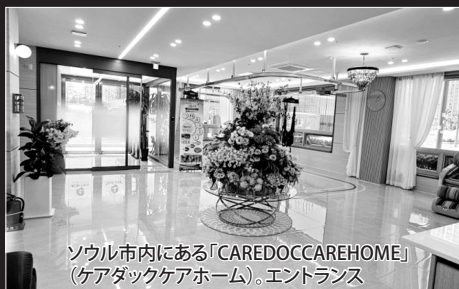
ソウル市内にある「CAREDOCCAREHOME」 (ケアダックケアホーム)。エントランス